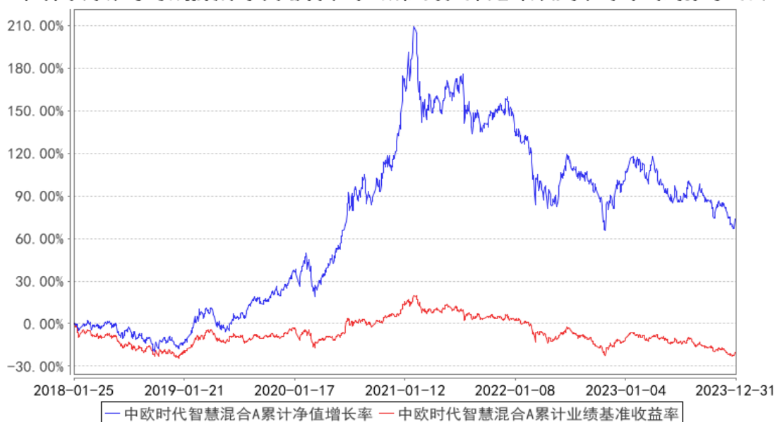
中欧时代智慧混合A累计净值增长率与同期业绩比较基准收益率的历史走势对比图