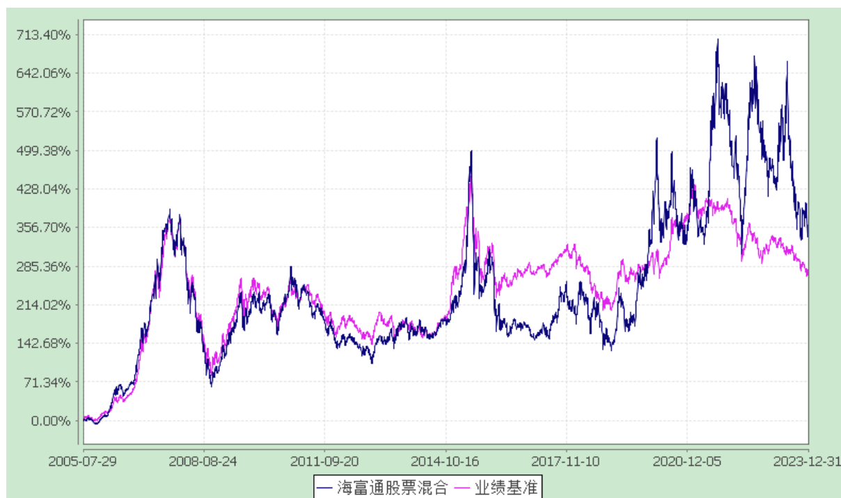
海富通股票混合型证券投资基金 份额累计净值增长率与业绩比较基准收益率的历史走势对比图 (2005 年 7 月 29 日至 2023 年 12 月 31 日)

注：1、按基金合同规定，本基金自基金合同生效起 6 个月内为建仓期。本基金自 2007 年 8 月 22 日至 2007 年 11 月 23 日为持续营销后建仓期。建仓期满至今本基金的各项投资比例已达到基金合同第 14 章（二）关于投资范围的规定；同时满足第 14 章（七）有关投资组合限制的各项比例要求。