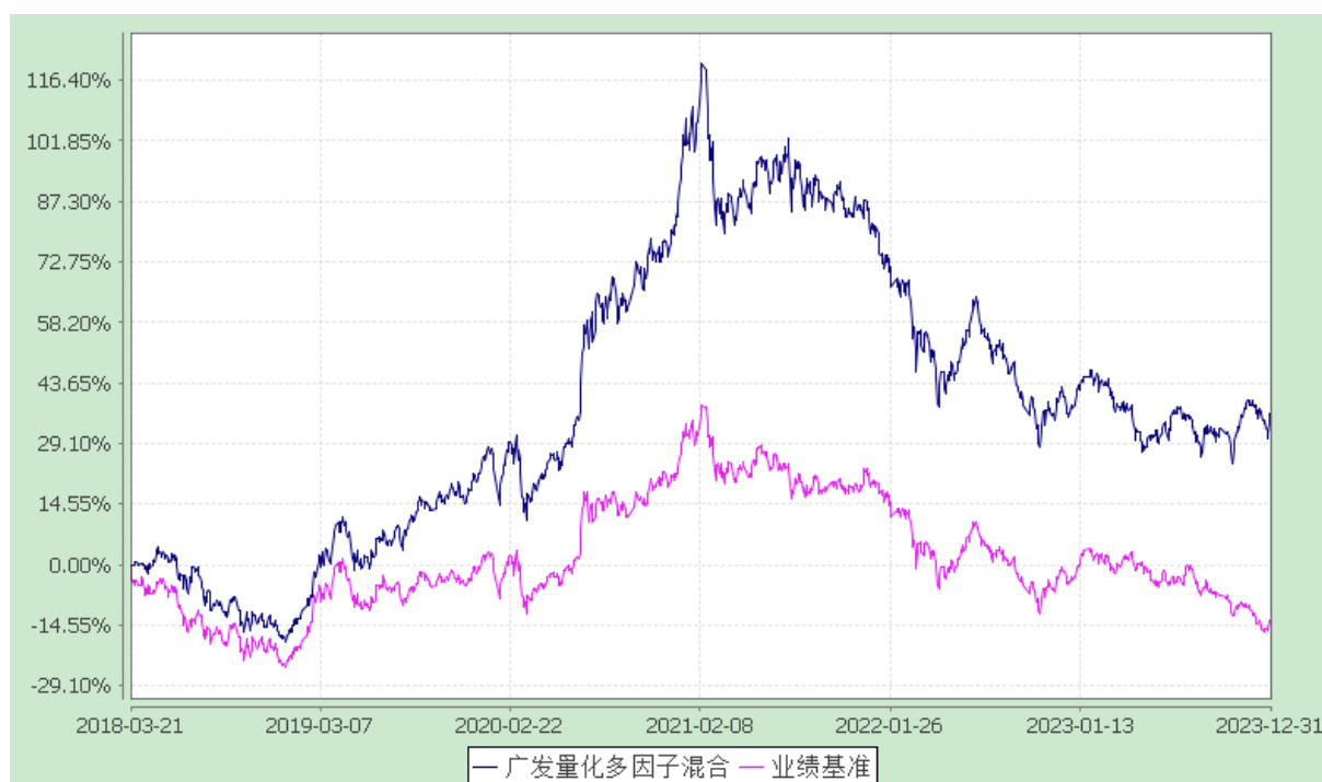
广发量化多因子灵活配置混合型证券投资基金 份额累计净值增长率与业绩比较基准收益率的历史走势对比图 (2018年3月21日至2023年12月31日)