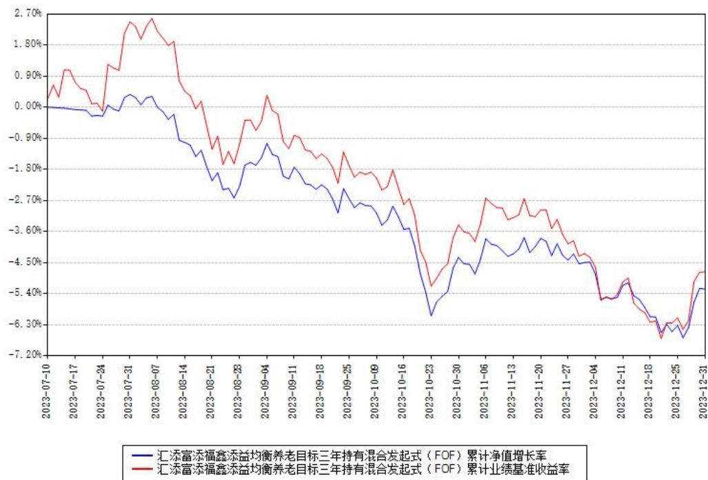
汇添富添福鑫添益均衡养老目标三年持有混合发起式（FOF）累计净值增长率与同期业绩基准收益率对比图

注：本《基金合同》生效之日为 2023 年 07 月 10 日，截至本报告期末，基金成立未满一年。本基金建仓期为本《基金合同》生效之日起 6 个月，截至本报告期末，本基金尚处于建仓期中。