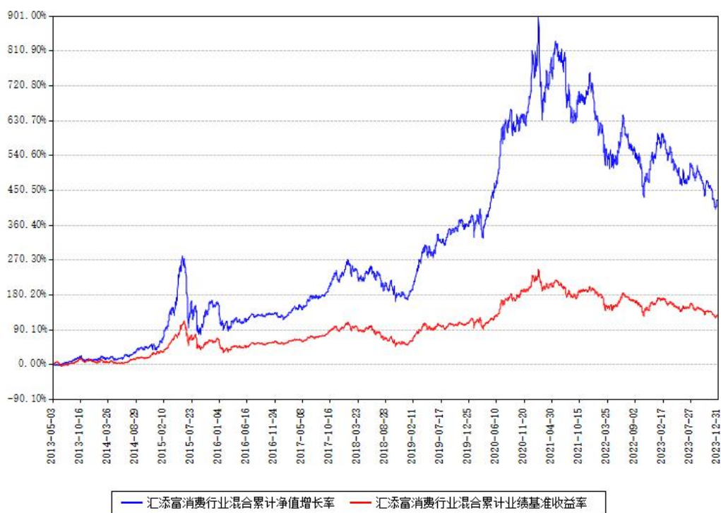
汇添富消费行业混合累计净值增长率与同期业绩基准收益率对比图

注：本基金建仓期为本《基金合同》生效之日（2013年05月03日）起6个月，建仓期结束时各项资产配置比例符合合同约定。