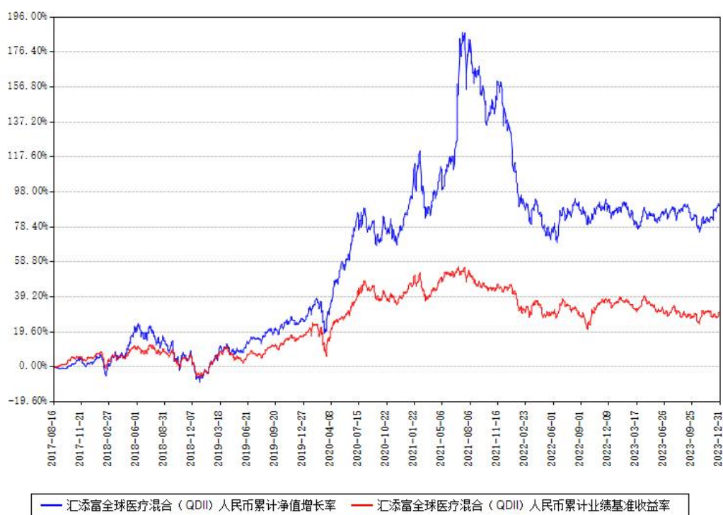
汇添富全球医疗混合（QDII）人民币累计净值增长率与同期业绩基准收益率对比图