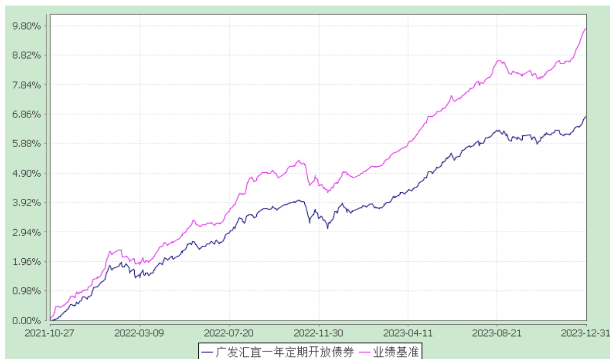
广发汇宜一年定期开放债券型证券投资基金 份额累计净值增长率与业绩比较基准收益率的历史走势对比图 (2021 年 10 月 27 日至 2023 年 12 月 31 日)