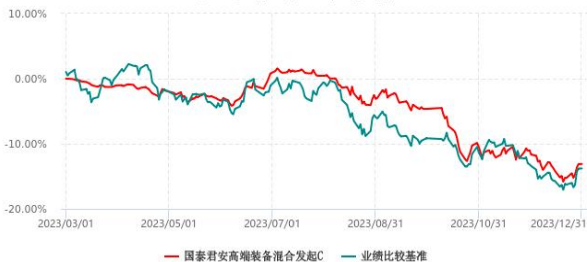
国泰君安高端装备混合发起C累计净值增长率与业绩比较基准收益率历史走势对比图 (2023年03月01日-2023年12月31日)

注：1、本基金于 2023 年 3 月 1 日成立，自合同生效日起至本报告期末不足一年。