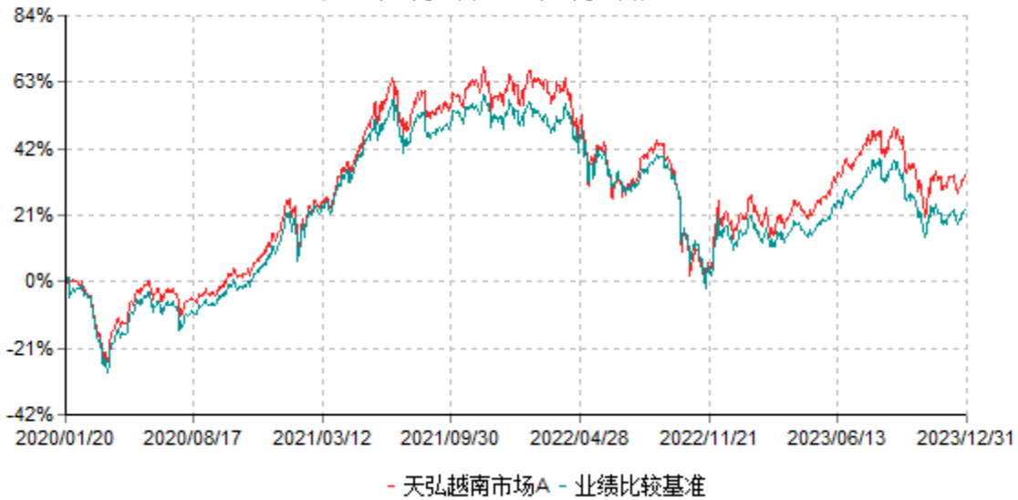
天弘越南市场A累计净值增长率与业绩比较基准收益率历史走势对比图 (2020年01月20日-2023年12月31日)