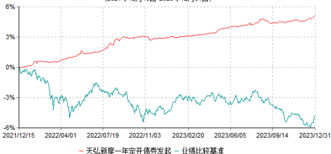
天弘新享一年定期开放债券型发起式证券投资基金累计净值增长率与业绩比较基准收益率历史走势对比图 (2021年12月15日-2023年12月31日)