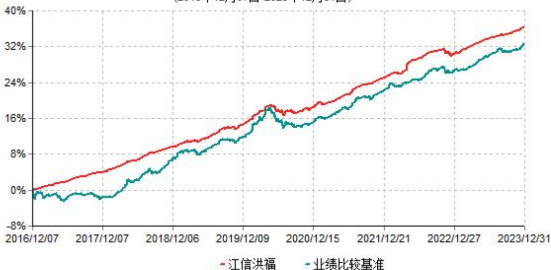
江信洪福纯债债券型证券投资基金累计净值增长率与业绩比较基准收益率历史走势对比图 (2016年12月07日-2023年12月31日)