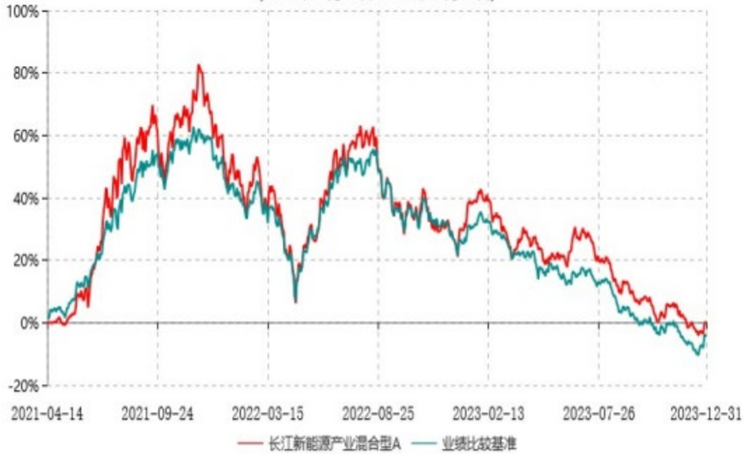
长江新能源产业混合型C累计净值增长率与业绩比较基准收益率历史走势对比图