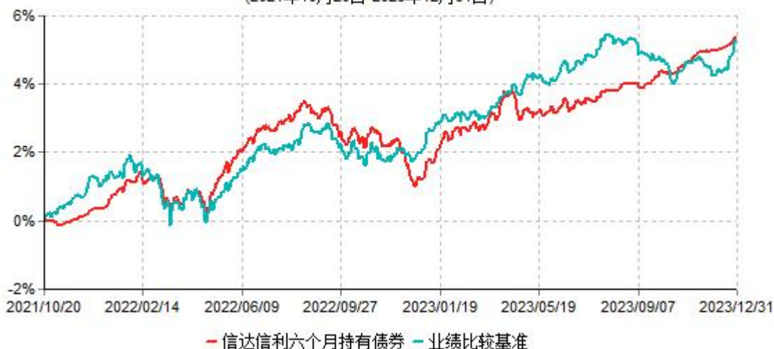
信达信利六个月持有期债券型集合资产管理计划累计净值增长率与业绩比较基准收益率历史走势对比图 (2021年10月20日-2023年12月31日)