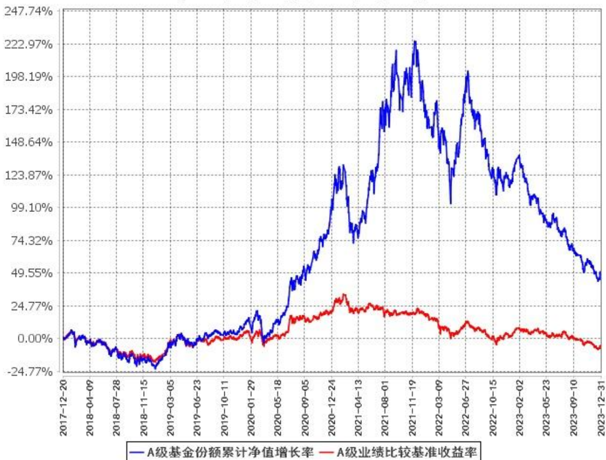
A级基金份额累计净值增长率与同期业绩比较基准收益率的历史走势对比图 (2017年12月20日至2023年12月31日)