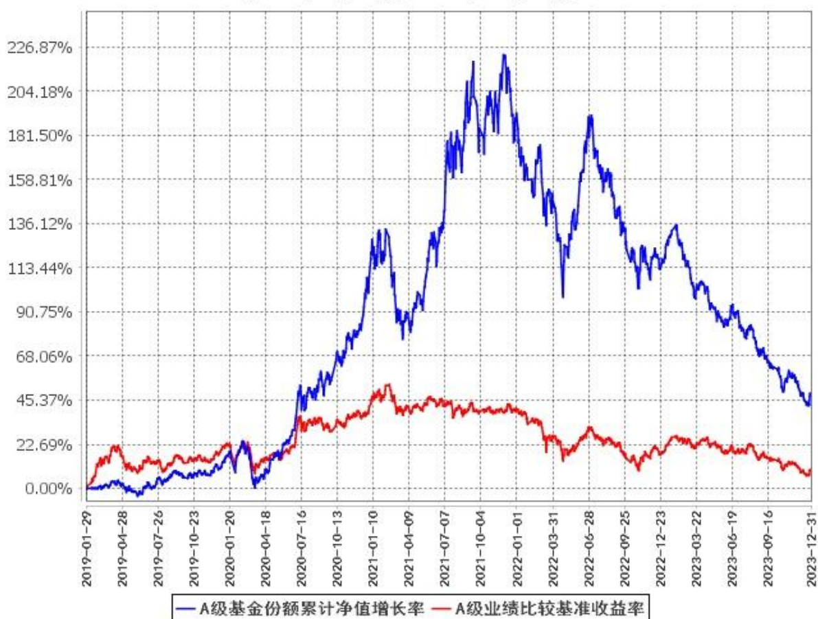
A级基金份额累计净值增长率与同期业绩比较基准收益率的历史走势对比图 (2019年1月29日至2023年12月31日)