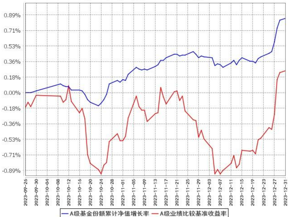
A级基金份额累计净值增长率与同期业绩比较基准收益率的历史走势对比图 (2023年9月26日至2023年12月31日)