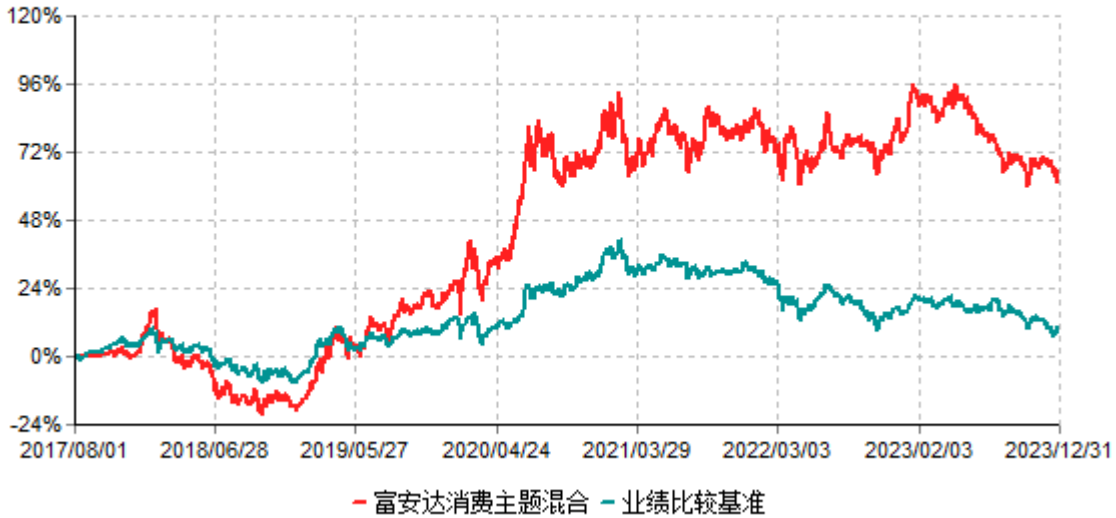
富安达消费主题灵活配置混合型证券投资基金累计净值增长率与业绩比较基准收益率历史走势对比图 (2017年08月01日-2023年12月31日)

注：本基金原业绩比较基准为：沪深300指数收益率*60%+中债总指数收益率*40%，修订后的业绩比较基准为：中证内地消费主题指数*60%+中债总指数收益率*40%，修改后的业绩比较基准生效日为2023年7月25日。