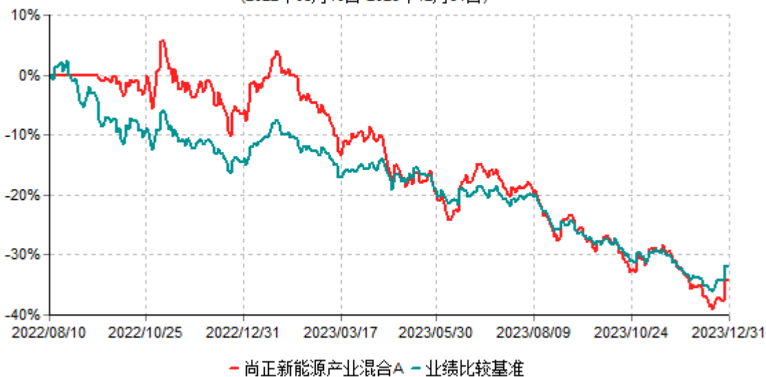
尚正新能源产业混合A累计净值增长率与业绩比较基准收益率历史走势对比图 (2022年08月10日-2023年12月31日)