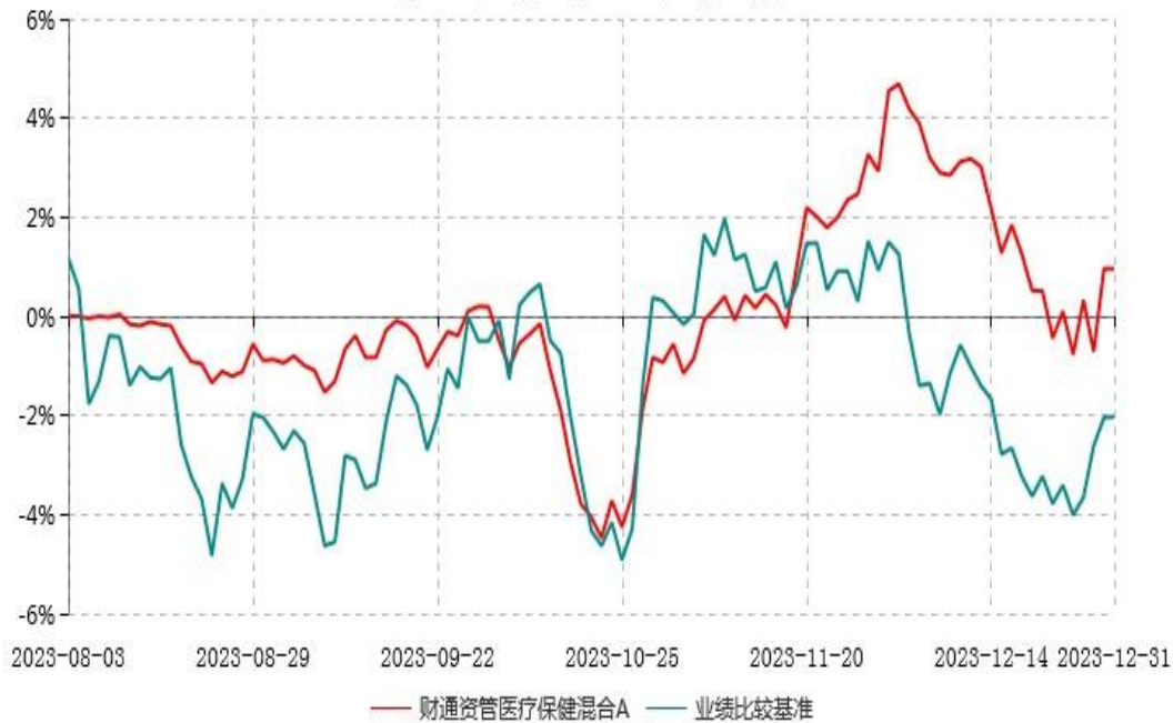
财通资管医疗保健混合A累计净值增长率与业绩比较基准收益率历史走势对比图 (2023年08月03日-2023年12月31日)