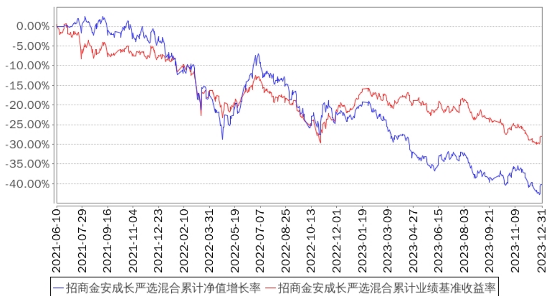
招商金安成长严选混合累计净值增长率与同期业绩比较基准收益率的历史走势对比图