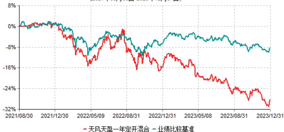
天风天盈一年定期开放混合型集合资产管理计划累计净值增长率与业绩比较基准收益率历史 走势对比图 (2021年08月30日-2023年12月31日)