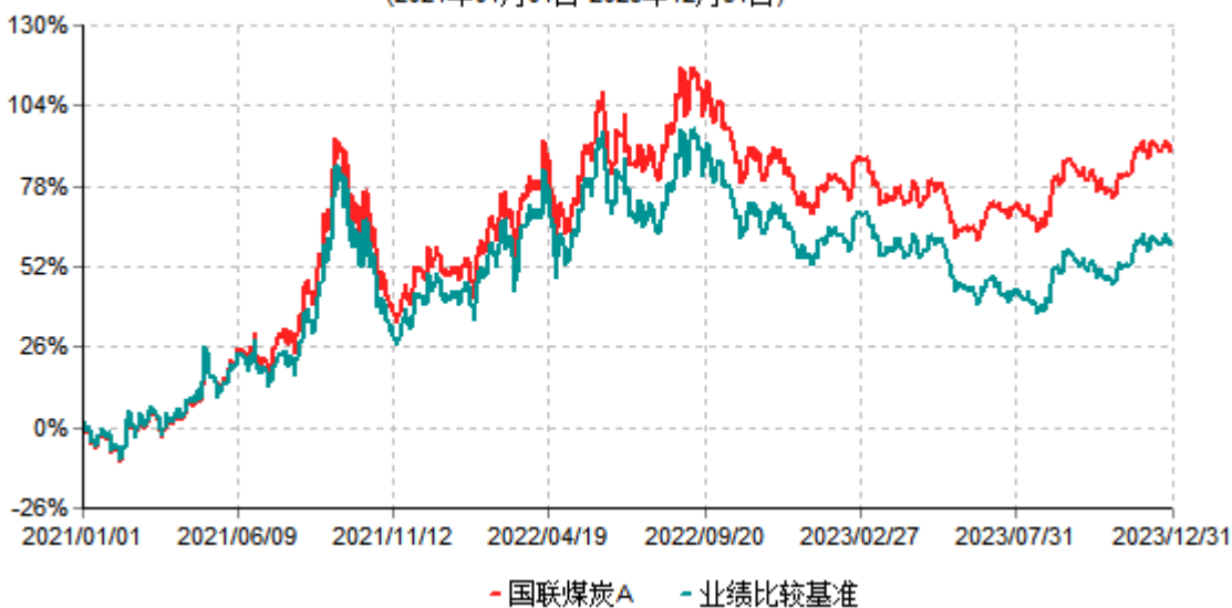
国联煤炭A累计净值增长率与业绩比较基准收益率历史走势对比图 (2021年01月01日-2023年12月31日)