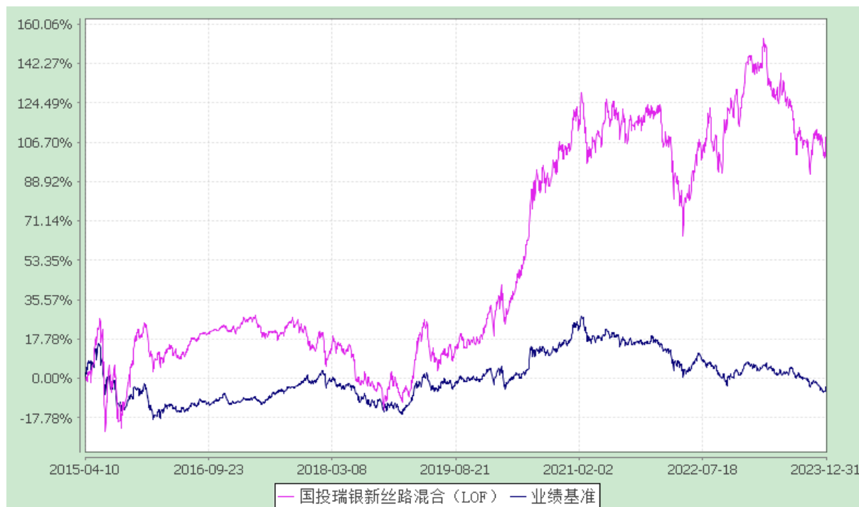
国投瑞银新丝路灵活配置混合型证券投资基金（LOF） 份额累计净值增长率与业绩比较基准收益率的历史走势对比图 (2015 年 4 月 10 日至 2023 年 12 月 31 日)

注：本基金建仓期为自基金合同生效日起的 6 个月。截至建仓期结束，本基金各项资产配置比例符合基金合同及招募说明书有关投资比例的约定。