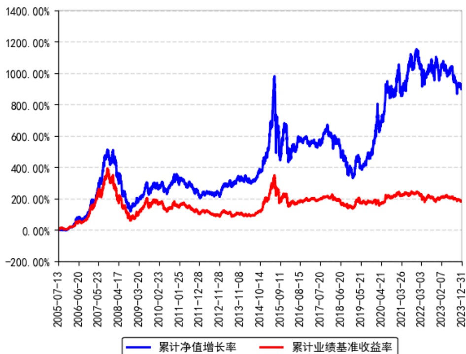
南方高增长混合（LOF）累计净值增长率与同期业绩比较基准收益率的历史走势对比图