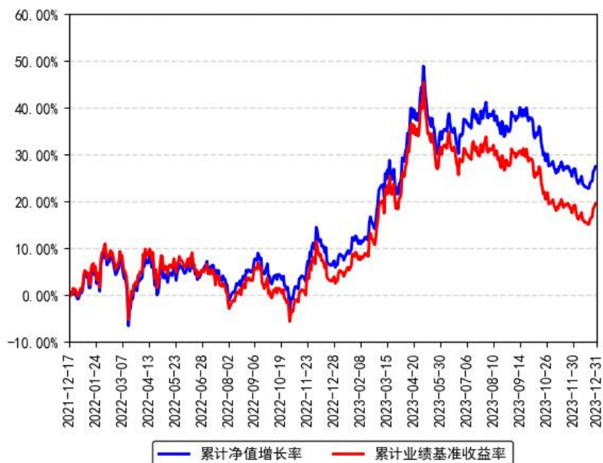
南方富时中国国企开放共赢ETF累计净值增长率与同期业绩比较基准收益率的历史走势对比图