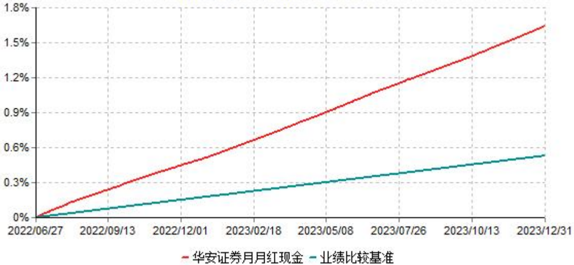
华安证券月月红现金管理型集合资产管理计划累计净值收益率与业绩比较基准收益率历史走势对比图 (2022年06月27日-2023年12月31日)