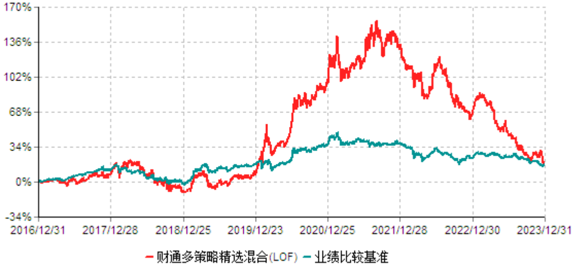
财通多策略精选混合型证券投资基金(LOF)累计净值增长率与业绩比较基准收益率历史走势对比图 (2016年12月31日-2023年12月31日)

注：(1)本基金合同生效日为2015年7月1日，转型日期为2016年12月31日； (2)本基金建仓期为基金合同生效起6个月，截至建仓期末与本报告期内，本基金的资产配置符合基金契约的相关要求。