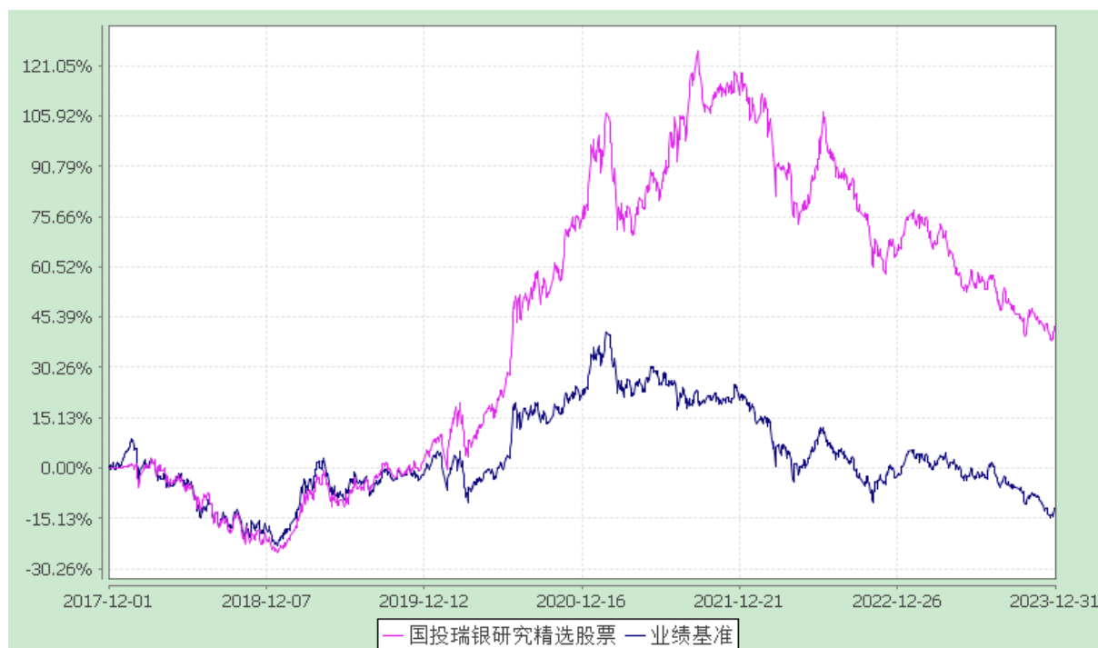
国投瑞银研究精选股票型证券投资基金 份额累计净值增长率与业绩比较基准收益率的历史走势对比图 (2017 年 12 月 1 日至 2023 年 12 月 31 日)

注：本基金建仓期为自基金合同生效日起的 6 个月。截至建仓期结束，本基金各项资产配置比例符合基金合同及招募说明书有关投资比例的约定。