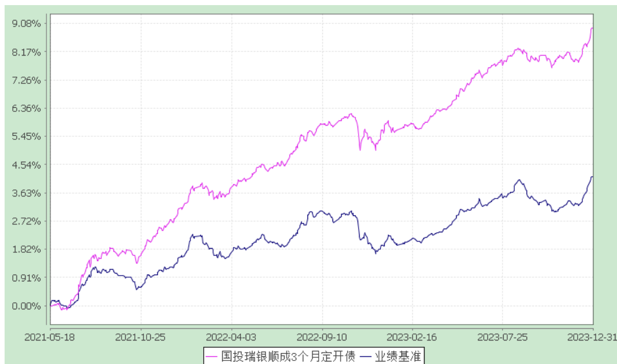
国投瑞银顺成 3 个月定期开放债券型证券投资基金 份额累计净值增长率与业绩比较基准收益率的历史走势对比图 (2021 年 5 月 18 日至 2023 年 12 月 31 日)

注：本基金建仓期为自基金合同生效日起的 6 个月。截至建仓期结束，本基金各项资产配置比例符合基金合同及招募说明书有关投资比例的约定。