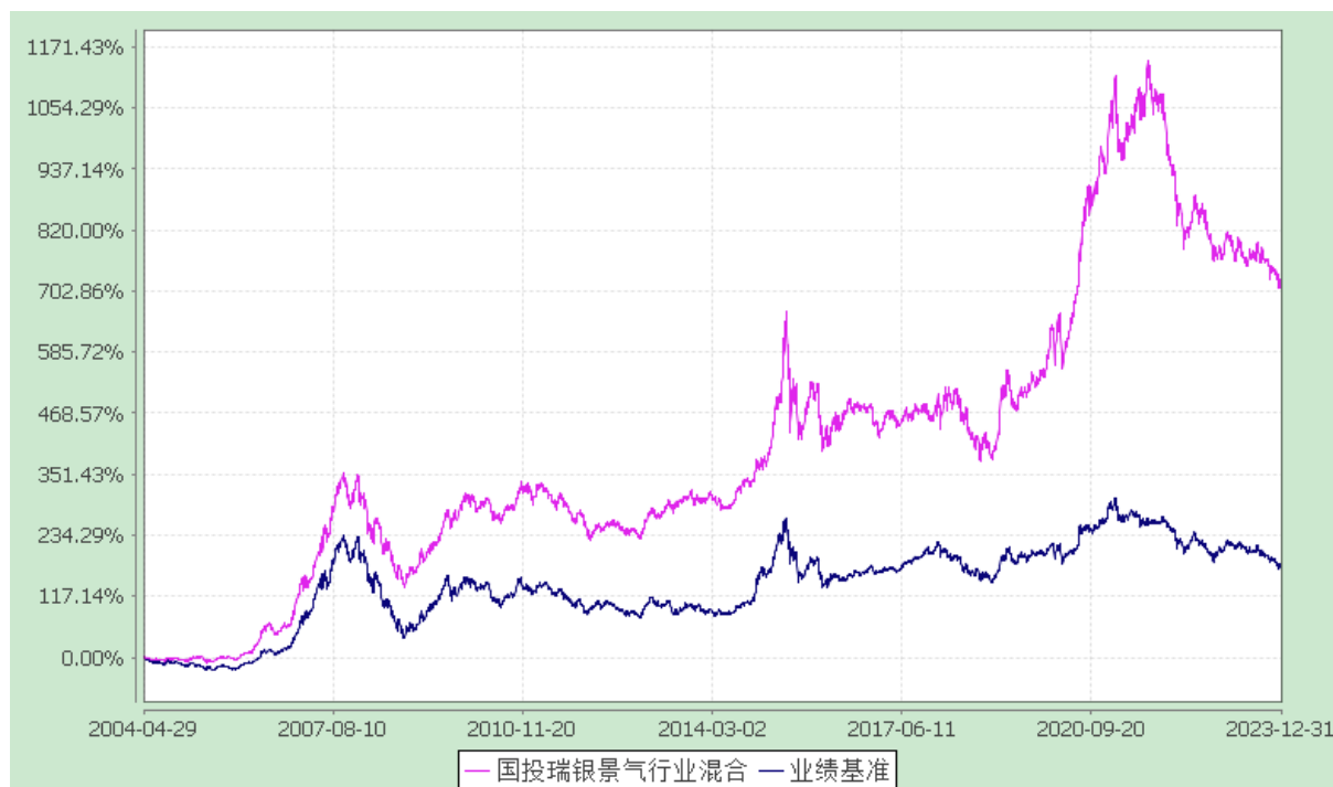
国投瑞银景气行业证券投资基金 份额累计净值增长率与业绩比较基准收益率的历史走势对比图 (2004 年 4 月 29 日至 2023 年 12 月 31 日)

注：本基金建仓期为自基金合同生效日起的 6 个月。截至建仓期结束，本基金各项资产配置比例符合基金合同及招募说明书有关投资比例的约定。