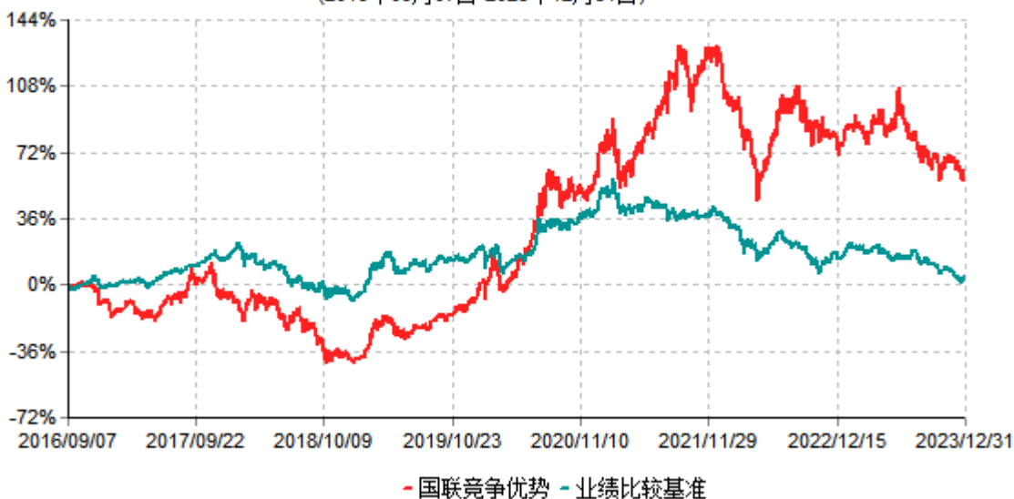
国联竞争优势股票型证券投资基金累计净值增长率与业绩比较基准收益率历史走势对比图 (2016年09月07日-2023年12月31日)

注：按基金合同和招募说明书的约定，本基金自基金合同生效日起6个月内为建仓期，建仓期结束时本基金的各项投资比例符合基金合同的有关约定。