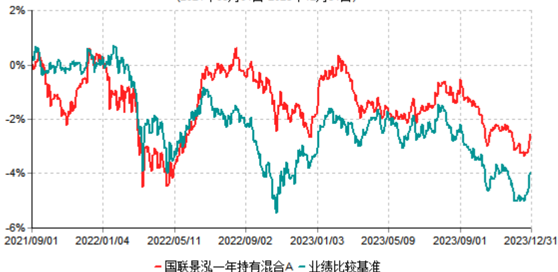
国联景泓一年持有混合A累计净值增长率与业绩比较基准收益率历史走势对比图 (2021年09月01日-2023年12月31日)