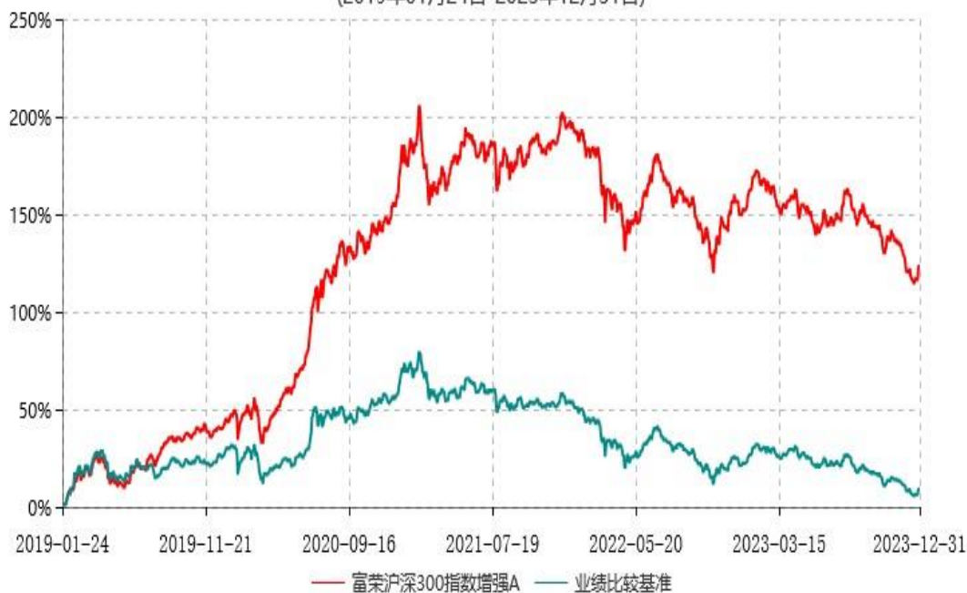
富荣沪深300指数增强C累计净值增长率与业绩比较基准收益率历史走势对比图