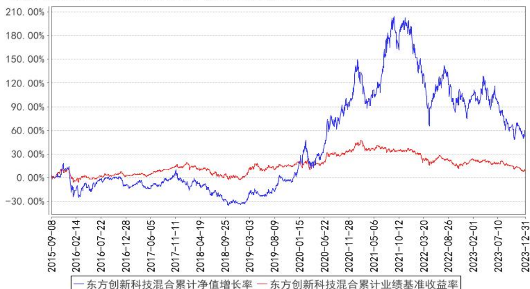
东方创新科技混合累计净值增长率与同期业绩比较基准收益率的历史走势对比图