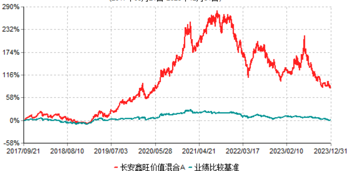
长安鑫旺价值混合A累计净值增长率与业绩比较基准收益率历史走势对比图 (2017年09月21日-2023年12月31日)

根据基金合同的规定,自基金合同生效之日起6个月内基金各项资产配置比例需符合基金合同要求。本基金在建仓期结束后,各项资产配置比例已符合基金合同有关投资比例的约定。基金合同生效日至报告期末,本基金运作时间已满一年。图示日期为2017年9月21日至2023年12月31日。