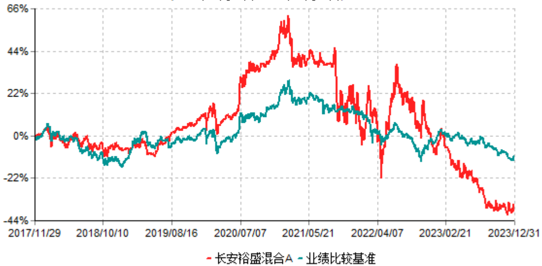
长安裕盛混合A累计净值增长率与业绩比较基准收益率历史走势对比图 (2017年11月29日-2023年12月31日)

根据基金合同的规定,自基金合同生效之日起6个月内基金各项资产配置比例需符合基金合同要求。本基金在建仓期结束后,各项资产配置比例已符合基金合同有关投资比例的约定。基金合同生效日至报告期期末,本基金运作时间超过一年。图示日期为2017年11月29日至2023年12月31日。