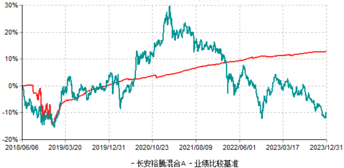
长安裕腾混合A累计净值增长率与业绩比较基准收益率历史走势对比图 (2018年06月06日-2023年12月31日)

根据基金合同的规定,自基金合同生效之日起6个月内基金各项资产配置比例需符合基金合同要求。本基金在建仓期结束后,各项资产配置比例已符合基金合同有关投资比例的约定。基金合同生效日至报告期末,本基金运作时间已满一年。图示日期为2018年06月06日至2023年12月31日。