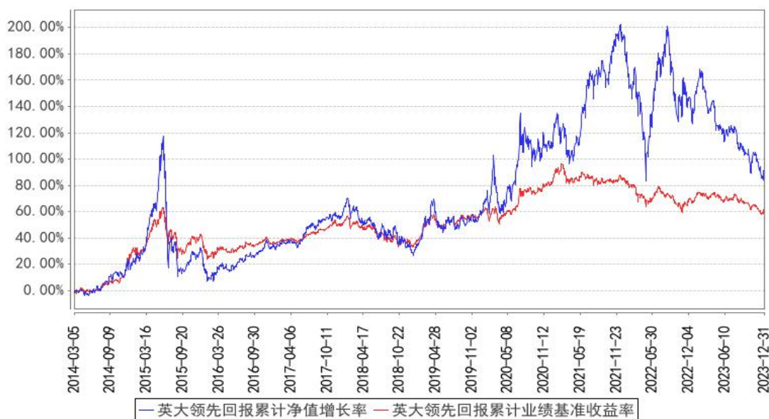
英大领先回报累计净值增长率与同期业绩比较基准收益率的历史走势对比图