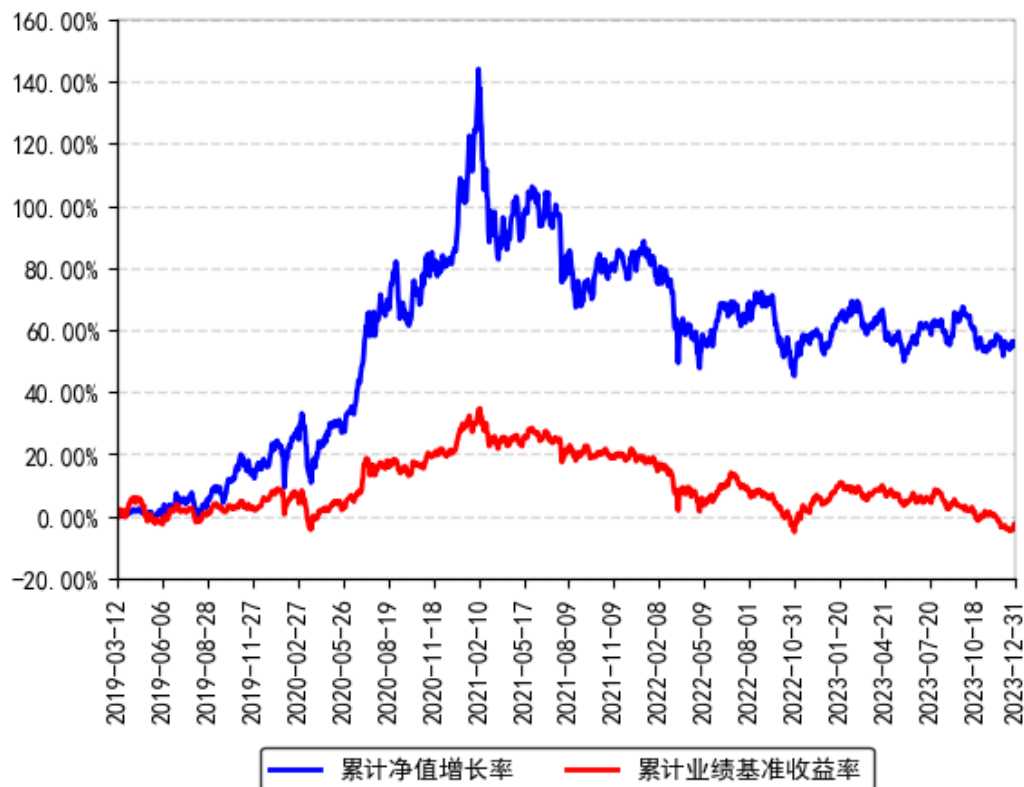
南方智诚混合累计净值增长率与同期业绩比较基准收益率的历史走势对比图