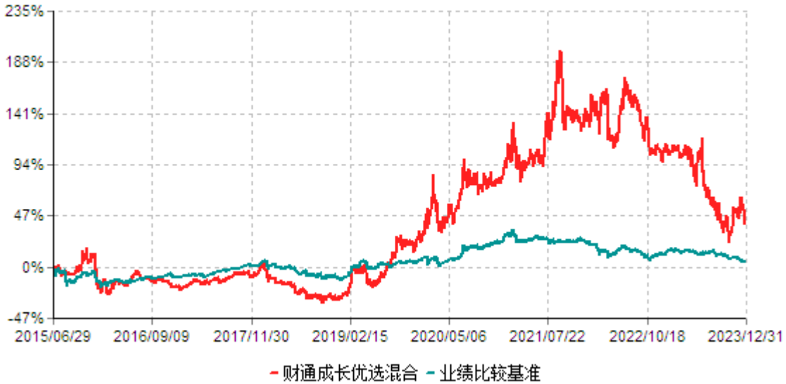
财通成长优选混合型证券投资基金累计净值增长率与业绩比较基准收益率历史走势对比图 (2015年06月29日-2023年12月31日)

注：(1)本基金合同生效日为2015年6月29日； (2)本基金建仓期为基金合同生效起6个月，截至建仓期末及本报告期末，本基金的资产配置符合基金契约的相关要求。