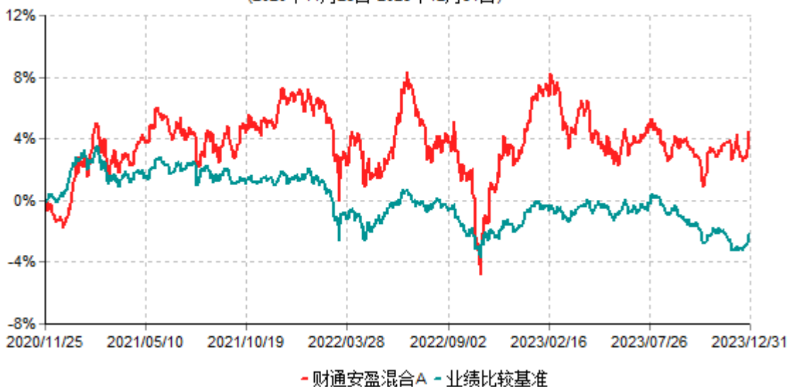
财通安盈混合A累计净值增长率与业绩比较基准收益率历史走势对比图 (2020年11月25日-2023年12月31日)