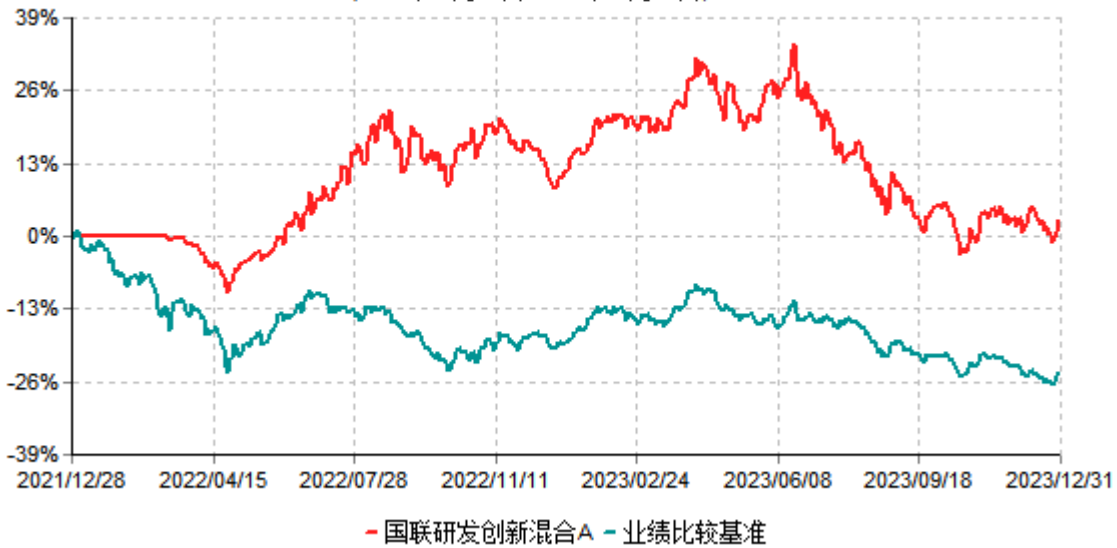
国联研发创新混合A累计净值增长率与业绩比较基准收益率历史走势对比图 (2021年12月28日-2023年12月31日)