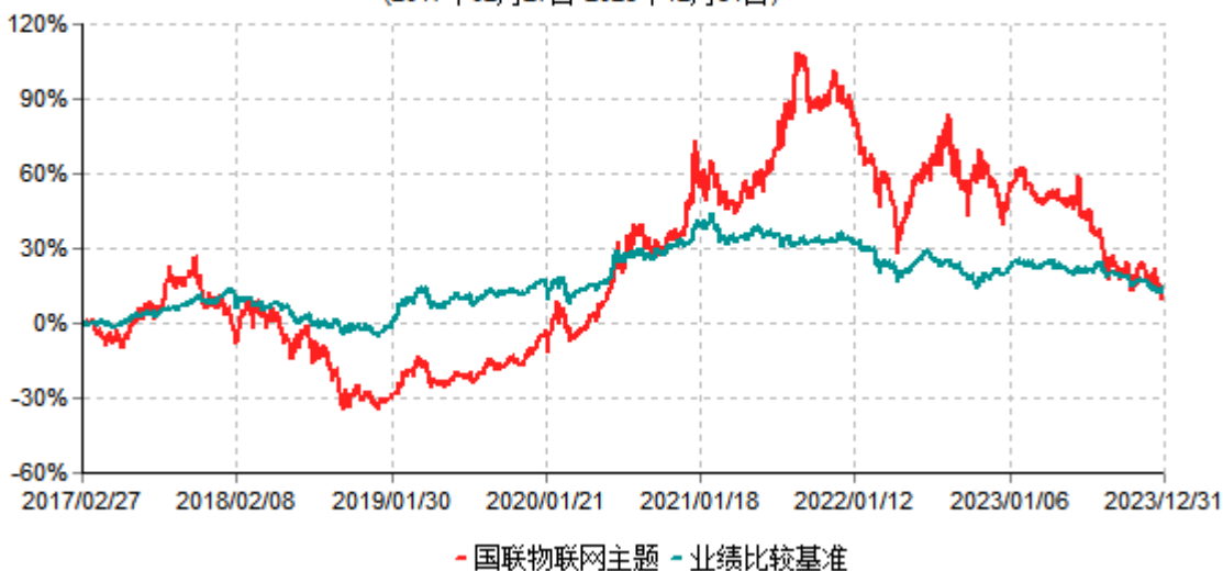
国联物联网主题灵活配置混合型证券投资基金累计净值增长率与业绩比较基准收益率历史走势对比图 (2017年02月27日-2023年12月31日)

注：按基金合同和招募说明书的约定，本基金自基金合同生效日起6个月内为建仓期，建仓期结束时本基金的各项投资比例符合基金合同的有关约定。