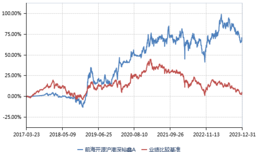
前海开源沪港深裕鑫 C