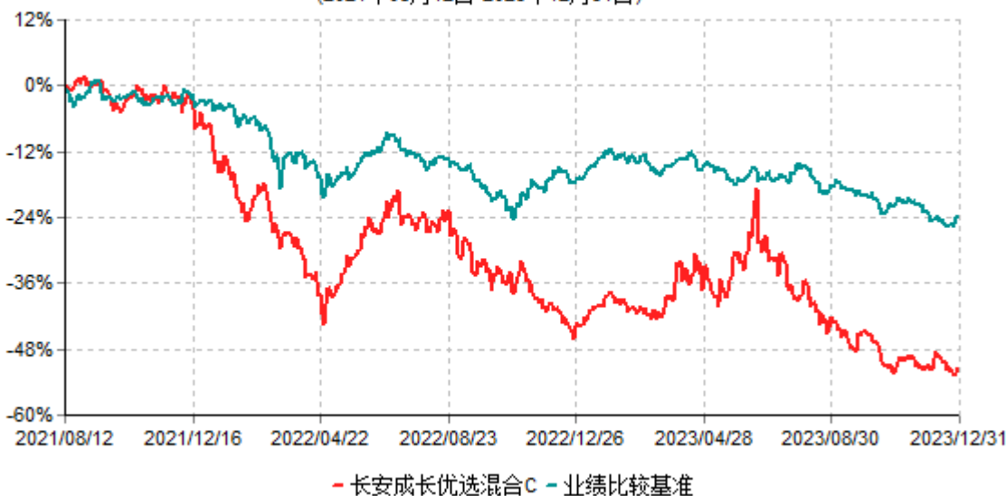
长安成长优选混合C累计净值增长率与业绩比较基准收益率历史走势对比图 (2021年08月12日-2023年12月31日)

根据基金合同的规定,自基金合同生效之日起6个月内基金各项资产配置比例需符合基金合同要求。本基金在建仓期结束后,各项资产配置比例已符合基金合同有关投资比例的约定。基金合同生效日至报告期末,本基金运作时间已满一年。图示日期为2021年08月12日至2023年12月31日。