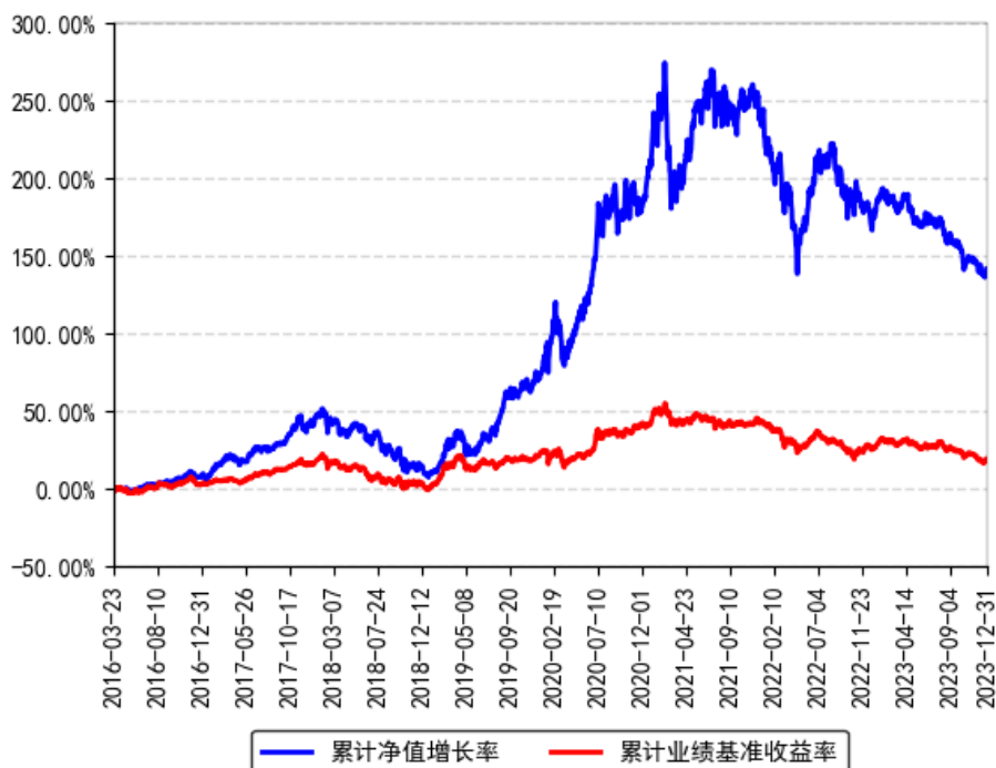
南方转型驱动灵活配置混合累计净值增长率与同期业绩比较基准收益率的历史走势对比图