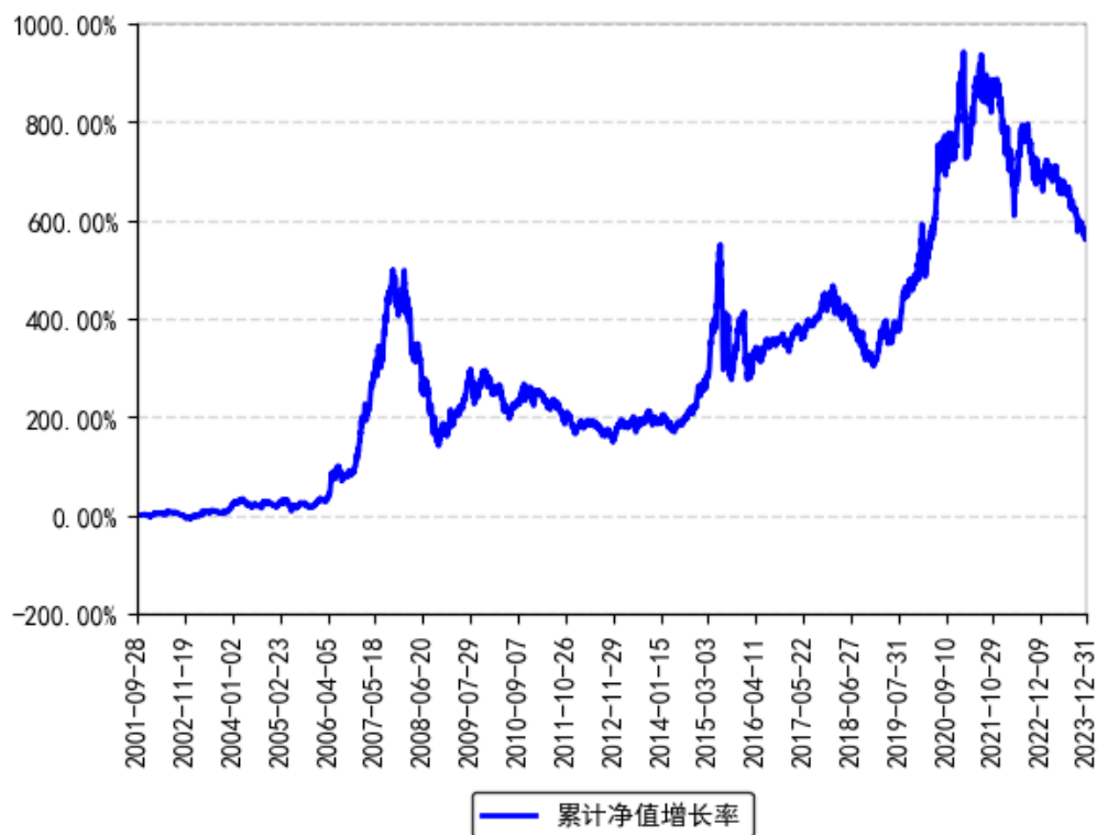
南方稳健成长混合累计净值增长率与同期业绩比较基准收益率的历史走势对比图