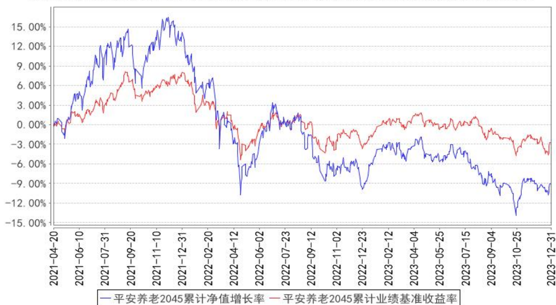
平安养老2045累计净值增长率与同期业绩比较基准收益率的历史走势对比图