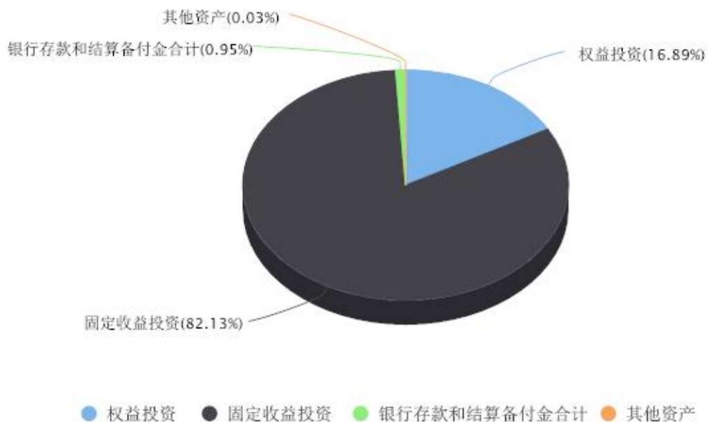
投资组合资产配置图表 数据截止日期:2023年09月30日