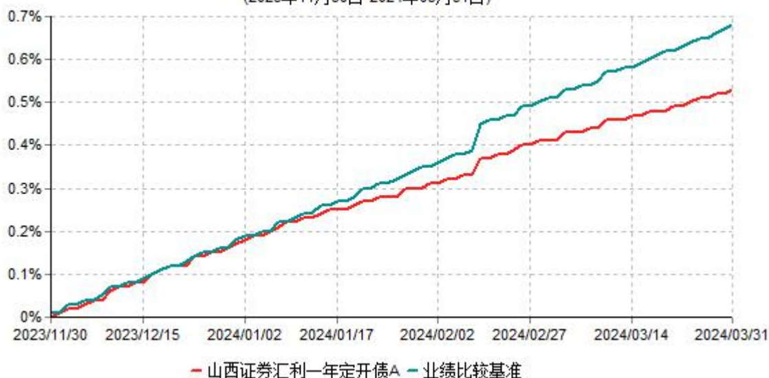
山西证券汇利一年定开债A累计净值增长率与业绩比较基准收益率历史走势对比图 (2023年11月30日-2024年03月31日)